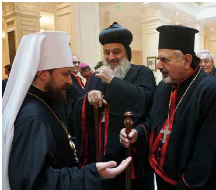
Patriarch Afrem II. (Mitte) im Gespräch mit dem russischen Metropolitan Hilarion (links) und dem syrisch-katholischen Patriarchen Ignatius Josef III. Younan (rechts).

Die Sprache ist ein sehr wichtiger Punkt: Wir müssen die eigene syrisch-aramäische Sprache pflegen und bewahren; vor allem auch in der Liturgie. Das ist aber oft nicht ganz einfach. Viele Gläubige aus Syrien oder dem Irak wollen die Liturgie lieber auf Arabisch, und die Gläubigen aus der Türkei hätten lieber Türkisch. Diejenigen, die schon in zweiter Generation in Österreich wohnen, werden vielleicht bald nach einer deutschsprachigen Liturgie fragen. Unser Ziel ist es aber, das Syrisch-Aramäische wieder zu unserer wesentlichen liturgischen Sprache zu machen.