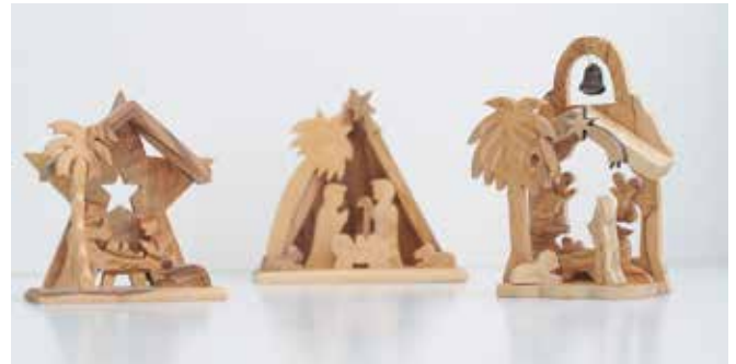
Altbewährtes und neue Motive im Sortiment der ICO-Aktion (hier nur ein kleiner Ausschnitt). Da ist sicher für jeden etwas dabei.