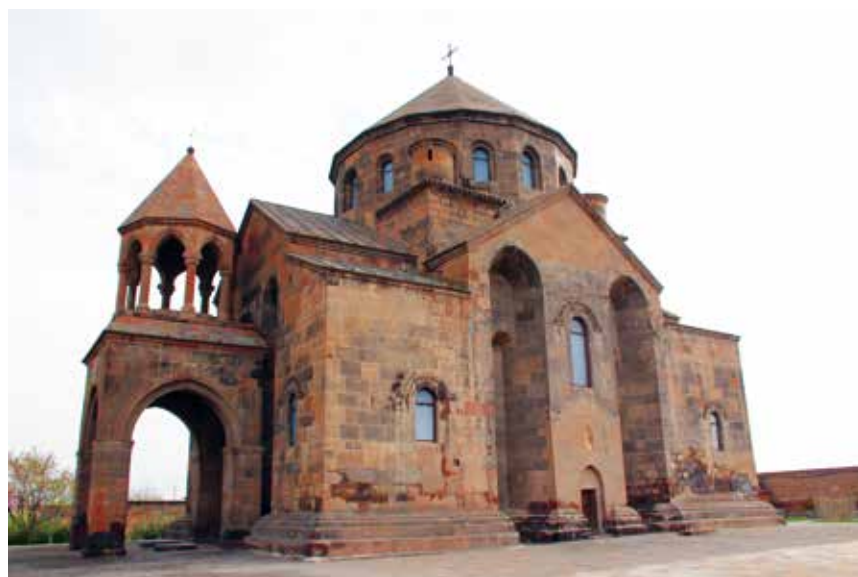
Hripsime-Kirche in Etschmiadsin (Armenien).

Einige der Frauen blieben laut Überlieferung am Berg Varag (heutige Ereğ Dağı) beim später danach benannten Kloster Varagavank, 35 (oder 31) Frauen aber gingen mit Hripsime und Gaiane in die damalige armenische Hauptstadt Valaršapat / Etschmiadsin.